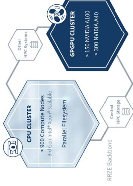
Abbildung 1: Struktur des NHR-Systems an der FAU.

Ende des Jahres 2020 hat die Friedrich-Alexander-Universität Erlangen-Nürnberg ihr erstes NHR-System ausgeschrieben. Mit einem Gesamtvolumen von 10 Millionen € ist dies der größte Parallelrechner, der jemals an der FAU installiert wurde. Nach einem harten Wettbewerb ging die MEGWARE Computer Vertrieb und Service GmbH aus Chemnitz als Sieger hervor.